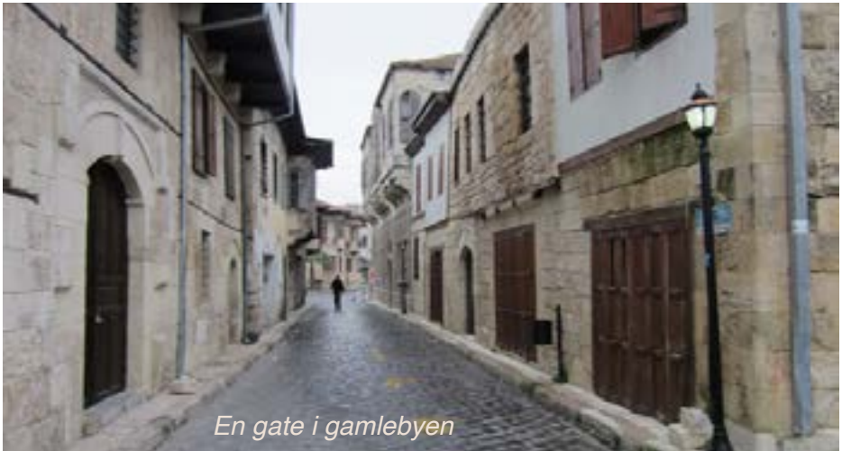
En gate i gamlebyen