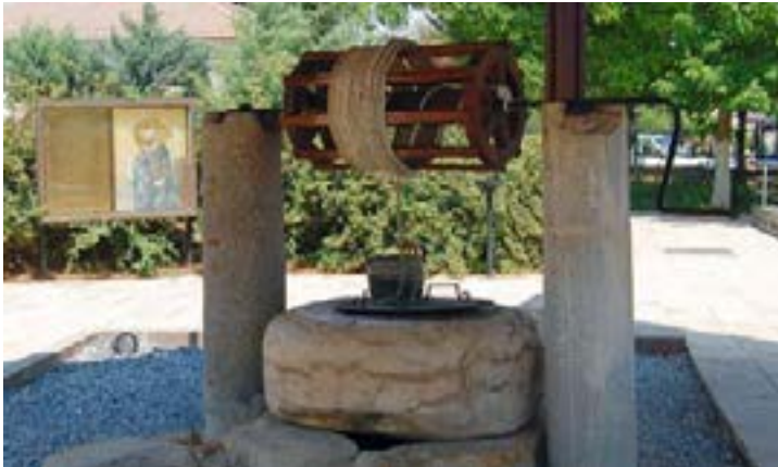
Tarsus: Paulus' brønn. Den er 2000 år gammel og er ca. 30 m dyp.