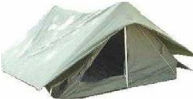
Hver fariseer måtte lære sønnene sine et yrke de kunne leve av. Paulus lærte å bli teltmaker.