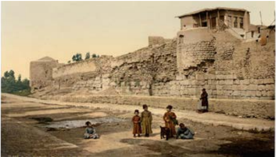
Muren som Paulus rømte over i Damaskus i Syria.

Flere bibelkommentarbøker hevder at Johannes Markus er forfatteren av Markus' evangelium, og at det var han som fulgte med disiplene til Getsemane hage, bare ikledd et laken (Markus 14:51). Han og familien hans spilte en sentral rolle i kristendommens første tid. Disiplene var samlet i hjemmet til hans mor da Peter kom ut av fengselet ved englers hjelp (Apg 12:12). Flere bibelkommentarbøker foreslår også at det var i dette hjemmet at Jesus holdt sitt siste måltid med disiplene. Kan det også være denne familien som eide Getsemanehagen, og som lot Jesus overnatte der ved flere anledninger? □